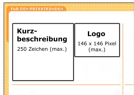
Visitenkarte "Starter" und "Starter plus"

Die Kurzbeschreibung dient zur Navigation in den Rubriken der Seite "Marktplatz" und wird per Zufallsgenerator auf der Startseite eingeblendet.